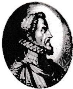
Charles II de Croÿ - 1560-1612